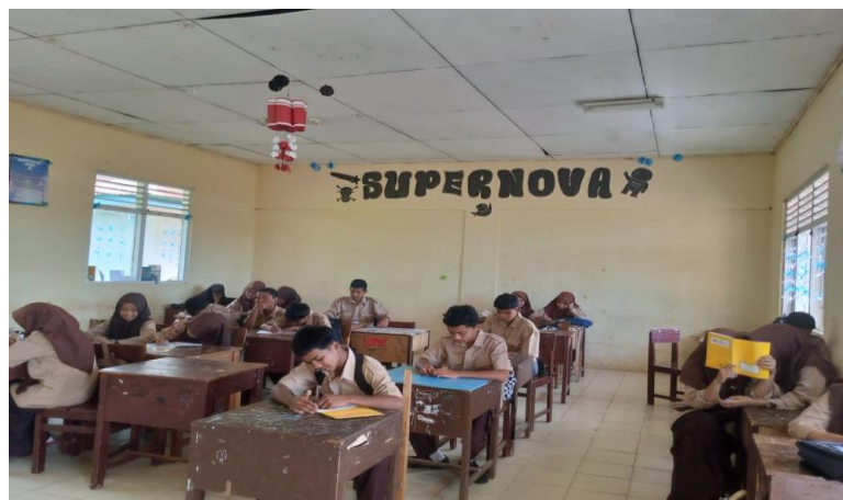
Gambar 1. Kegiatan gerakan literasi 15 Menit (Dokumentasi Pribadi, 2025)

Berdasarkan hasil wawancara dengan salah satu guru Seni Budaya di SMP Negeri 2 Salimpaung Informan 1, diperoleh informasi bahwa pelaksanaan Gerakan Literasi Sekolah (GLS) telah menjadi kegiatan rutin yang dilaksanakan setiap pagi sebelum pembelajaran dimulai. Kegiatan membaca selama 15 menit dinilai memberikan kontribusi terhadap peningkatan fokus belajar siswa, perluasan wawasan dan kosakata, peningkatan capaian akademik, serta pembentukan kebiasaan membaca yang positif. Namun demikian, dalam implementasinya masih ditemukan sejumlah kendala, di antaranya keterbatasan alokasi waktu, rendahnya minat baca sebagian siswa, serta kurang optimalnya pengawasan terhadap pelaksanaan kegiatan literasi tersebut (Hasil Wawancara Informan 1, 15 November 2025).