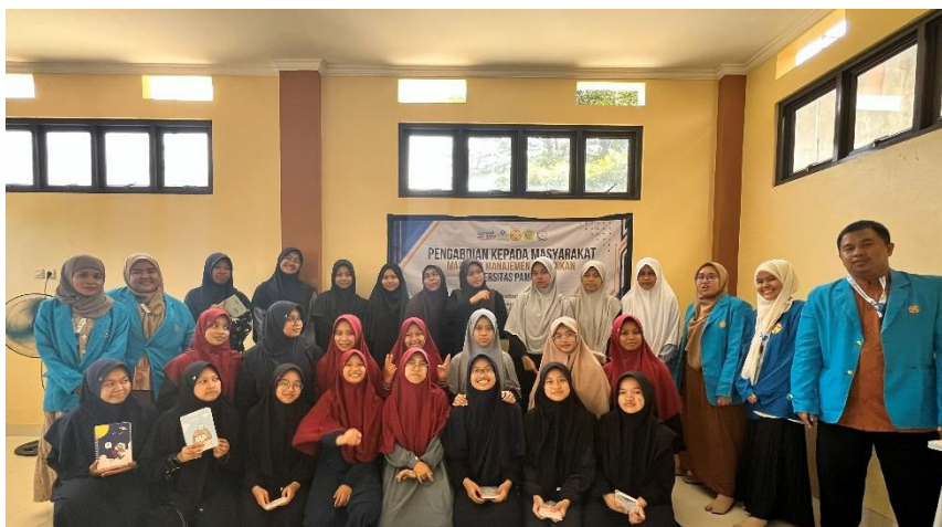
Gambar 3. Setelah Program Budaya Organisasi