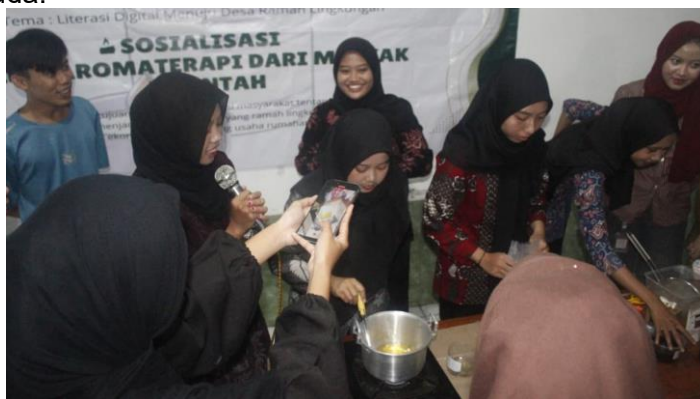
Gambar 2. Pelatihan Literasi Lingkungan

Berdasarkan Gambar 1, pelaksanaan program dilakukan melalui beberapa tahapan yang saling berkesinambungan. Tahap pertama adalah persiapan, yang meliputi koordinasi dengan pemerintah desa, pengelola wisata, tokoh masyarakat, dan pihak terkait lainnya. Kegiatan ini diikuti dengan survei awal untuk memetakan kondisi ekosistem pantai, kebiasaan masyarakat dalam mengelola sampah, serta identifikasi permasalahan lingkungan utama yang dihadapi. Tahap kedua adalah pemetaan aset komunitas. Pada tahap ini dilakukan identifikasi potensi lokal yang dapat dimanfaatkan untuk mendukung pelestarian lingkungan, seperti sumber daya manusia, fasilitas umum, dan praktik kearifan lokal yang relevan. Proses ini dilakukan melalui diskusi kelompok terarah (FGD) yang melibatkan warga, tokoh adat, pelaku wisata, dan kelompok pemuda.