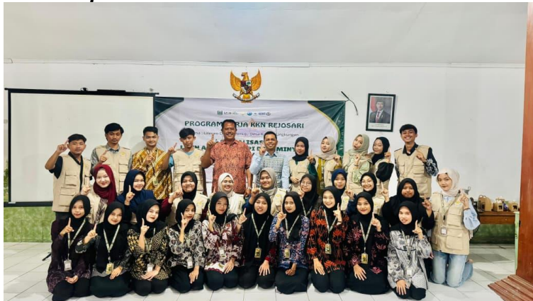
Gambar 4. Tim Pengabdian Kepada Masyarakat dan Kepala Desa

Pada gambar 4, terdapat dokumentasi dengan pihak desa. Dan pihak desa menghargai kinerja dari tim PKM ini. Meskipun program ini menunjukkan hasil positif, beberapa tantangan masih dihadapi. Pertama, keterbatasan fasilitas pengelolaan sampah yang memadai membuat sebagian besar sampah masih berakhir di TPA terbuka. Kedua, perilaku sebagian wisatawan yang belum tertib menjadi tantangan tersendiri, terutama saat musim liburan. Ketiga, risiko menurunnya partisipasi masyarakat jika tidak ada sistem monitoring yang berkelanjutan. Tantangan ini menunjukkan bahwa edukasi saja tidak cukup tanpa dukungan infrastruktur dan regulasi yang memadai. Model manajemen lingkungan terpadu yang direkomendasikan menekankan perlunya sinergi antara edukasi, infrastruktur, kebijakan, dan penegakan hukum untuk menciptakan perubahan yang berkelanjutan. Dalam konteks Pantai Dlado, sinergi ini dapat diwujudkan melalui kerja sama antara pemerintah desa, pengelola wisata, dan komunitas lokal.