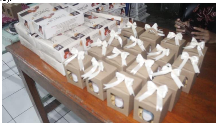
Gambar 3. Hasil Pelatihan Literasi Lingkungan

Pada gambar 3, merupakan bagian tahap ketiga adalah edukasi dan pelatihan, yang bertujuan meningkatkan literasi lingkungan masyarakat. Materi edukasi mencakup pengenalan ekosistem pesisir, dampak kerusakan lingkungan, serta praktik pengelolaan sampah berbasis konsep 3R (Reduce, Reuse, Recycle).